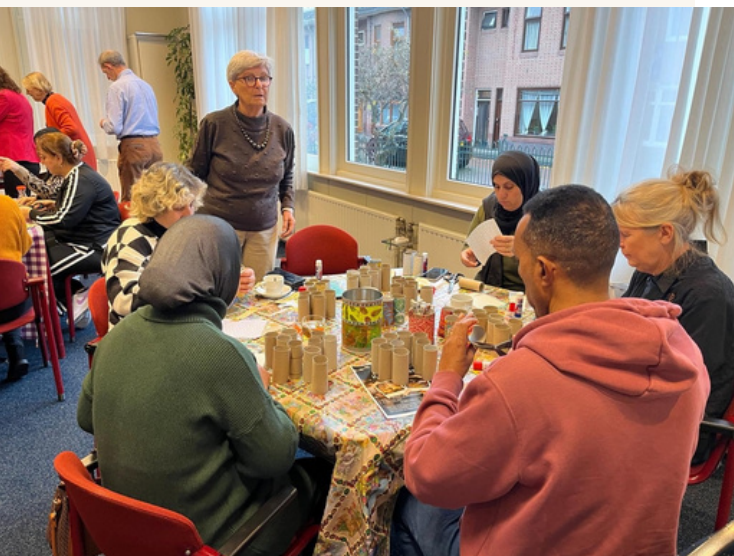
workshop kerststerren maken - zero waste