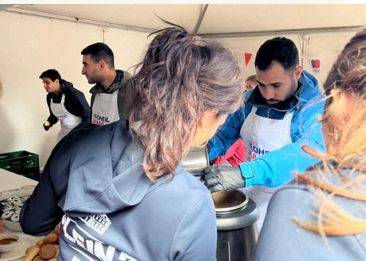
3 mannen uit de noodopvang zetten zich in tijdens Bevrijdingsdag.

Dit jaar zijn er geen statushouders opgevangen in het hotel.