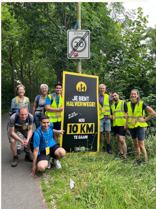
Met elkaar lopen voor mensen die op de vlucht zijn.

Natuurlijk blijven we doorbouwen aan meer verbinding en samenwerking met andere Woerdenaren en Woerdense organisaties.