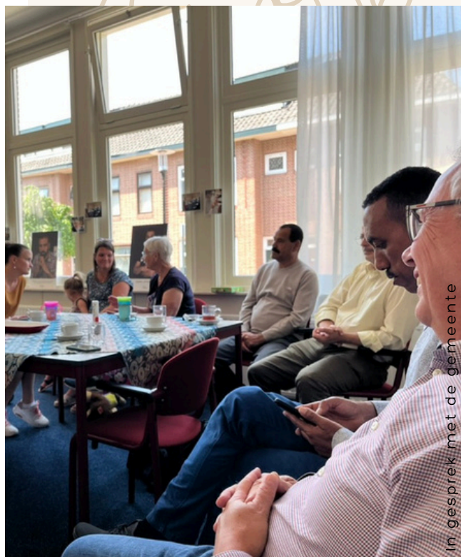
In gesprek met de gemeente